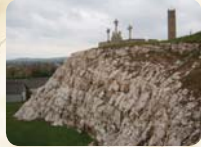
Útjára indult a sorozat Tata 1998