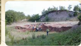
Felejthetetlen napok Erdélyben