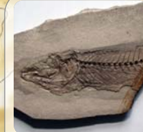
Hal vagyok? Vándorgyűlésen!