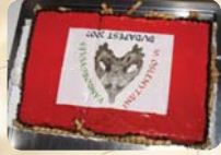
A tizedik találkozó tortája Budapest 2007