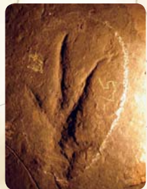
Mecseki fossziliák nyomában