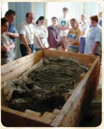
Szemtől-szemben az ősrorszarvúval Zirc 2003