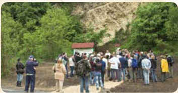
Tanösvényt avattunk, dinolelőhelyen jártunk