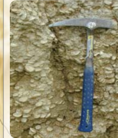
Hátszeg, Óralja- boldogfalva 2005