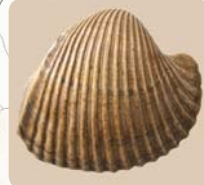
Limnocardium – Jó szívvel a tó partján