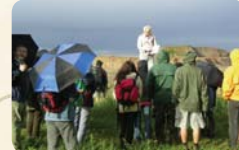
A magyar gerinces paleontológia bölcsőjénél