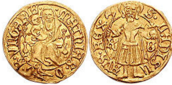
Mátyás király körmöci madonnás forintja

1433-ban elfoglalták és kifosztották a husziták. 1449-ben Hunyadi János sikertelenül ostromolta, a várost ekkor már magas kőfal és vizesárok védte. 1462-ben békekötéssel szerezte vissza Mátyás király. A támadásokat később is könnyen kivédte, 1560-ban azonban tűzvész pusztította és a város harmada leégett. A 16. században elterjedt a reformáció, a visszatérítés a jezsuiták révén 1653-ban indult meg. 1604-ben Bocskai serege előtt először nem nyitott kaput, de 1605-ben mégis behódolt. Bethlen Gábort is beengedte falai közé.