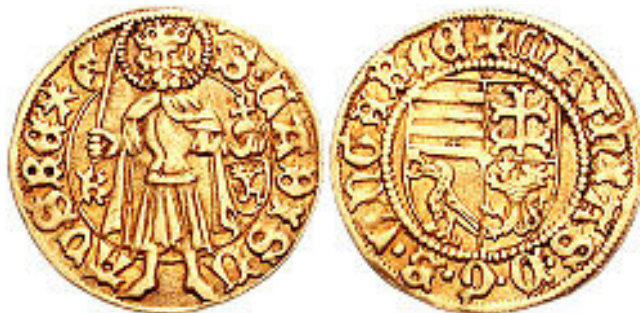
Mátyás király Körmöcbányán vert aranyforintja

Károly Róbert 1328. november 17-én szabad királyi bányavárosi jogokkal látta el és megalapította pénzverdéjét. 1335-től itt verték a híres aranyforintot, mely körmöci dukátként is ismert volt. A város fontossága miatt mindig a királyok kegyeit élvezte. 1390-ben lakói mentesültek a vámoktól. 1425-ben hetivásárok tartására kapott jogot. Aranybányászatának fénykora a 14-15. századra esik. A 15. század közepén a város 9 városnegedből állt, 250 házában 690 családban mintegy 3000 lakos élt. Évente már 14000 körmöci dukátot vertek itt.