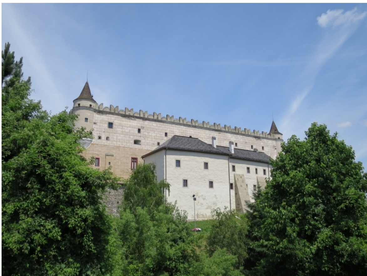
Reneszánsz várkastély, Balassi Bálint szülőhelye

Zólyom (Zvolen) legnagyobb nevezetessége a város főterétől délre egy kisebb magaslaton álló jellegzetes reneszánsz pártázatos vár. Szlovákia egyik legszebb gótikus-reneszánsz váraként a nemzeti kulturális emlékek közé tartozik, termeiben a Szlovák Nemzeti Galéria nagyszabású képzőművészeti gyűjteménye található.