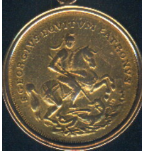
Szent György-tallér 14 dukát súlyú aranyverete az 1750-1780 közti időszakból, Körmöcbányáról.

A körmöcbányai pénzverde működését 1328. november 17-étől számíthatjuk: Károly Róbert ekkor adta ki II. Vencel cseh király 1300-ban kelt „Ius regale montanorum” nevű bányajogi kódexének mintájára azt a kiváltságlevelet, mely – más bányásztelepülések mellett – a körmöcbányai telepéseknek a csehországi Kutná Hora hospeseihez hasonló szabadságjogokat biztosított. A város ennek értelmében szabad királyi városi rangra emelkedett és pénzverdét állíthatott fel.